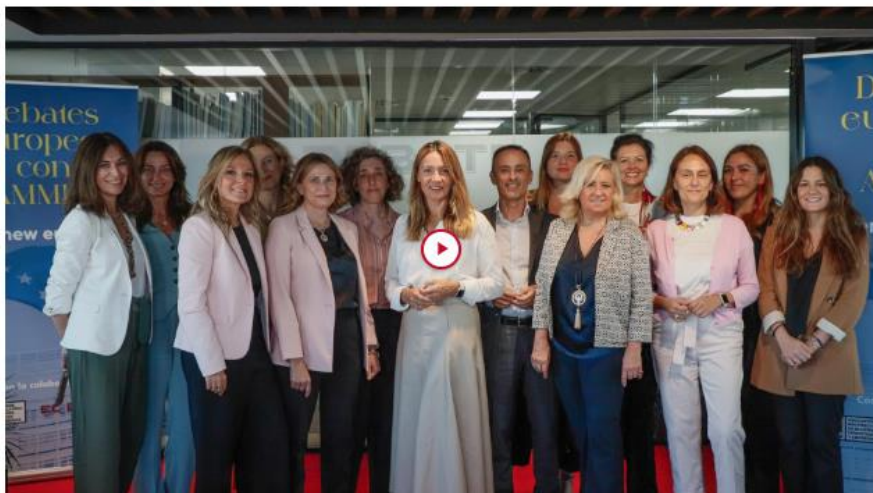
La eurodiputada Susana Solís (centro), en su reunión con representantes del sector de las telecomunicaciones - Paula Argüelles